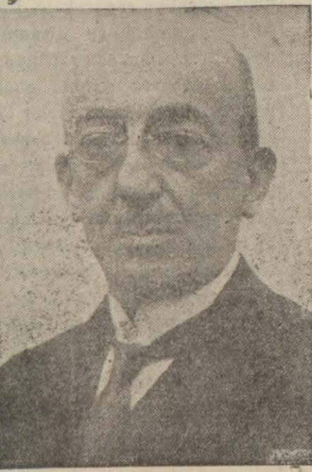
Başvekilimiz B Refik Saydam Türkiye ile Fransa arasındaki mukavelename saat 13,

Başvekilimiz müşterek beyannameden sonra bunu muhterem Millet vekillerinin tasvibine arz etmiş ve beyanname ittifakla tasvip olunmuştur.